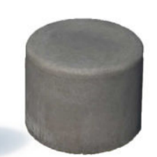
3 BETONNEN POEF (ROND Ø60 CM)