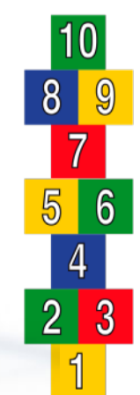
6 PHS PLEINPLAKKER HINKELPAD