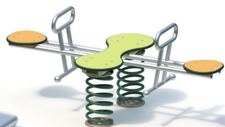
2 0-44262-000 VEERLEMENT