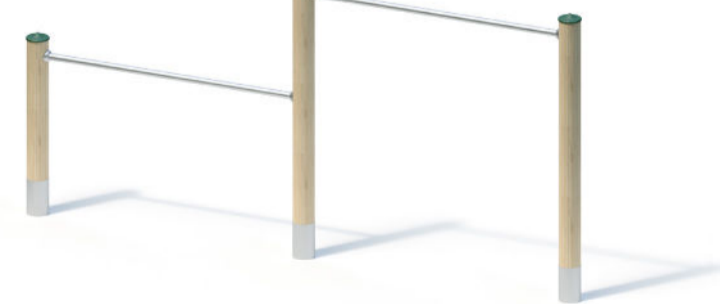
4 0-53215-700 DUIKELREK (0,90; 1,50 M.)