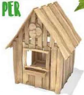
9 SPEELHUIS PER