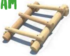
1 HIEVELLADDER LIAM