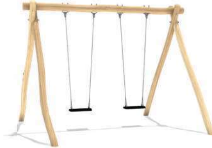
4 DUBBELE SCHOMMEL MALTE