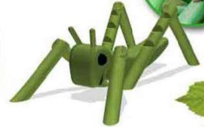
9 SPEELHUIS PER